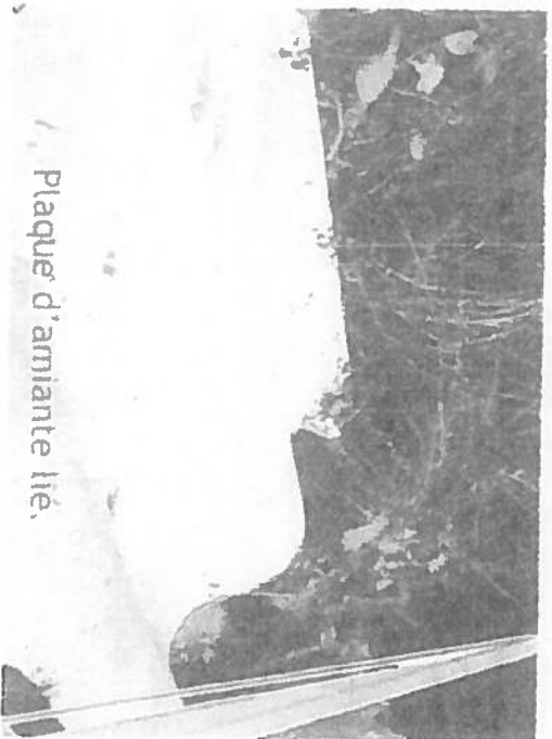
Plaque d'amiante lié.