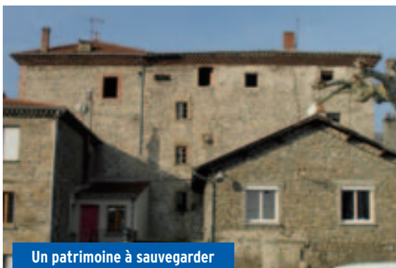
Un patrimoine à sauvegarder

Nous avons eu plusieurs fois l'occasion de l'évoquer : le château est devenu propriété communale, par suite de la donation qui en a été consentie par son propriétaire, consécutivement au succès remporté par sa visite organisée lors des journées du patrimoine en septembre 2008.