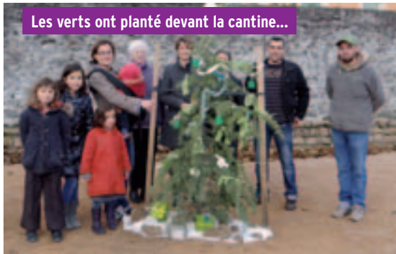
Les verts ont planté devant la cantine...

Tout le monde doit être costumé pour une ambiance festive réussie !