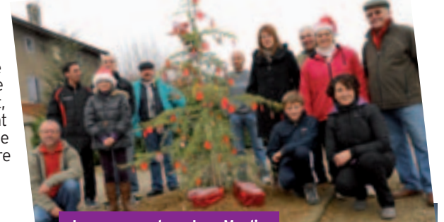
Les rouges, place Jean Moulin