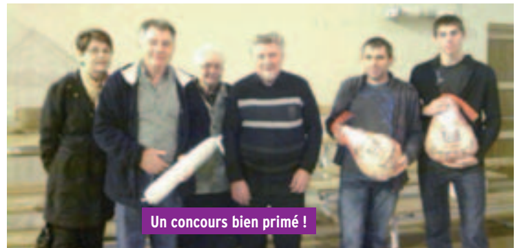
Un concours bien primé !

Nous vous attendons tous très nombreux l'année prochaine. Nous remercions toutes les personnes qui ont donné des lots.