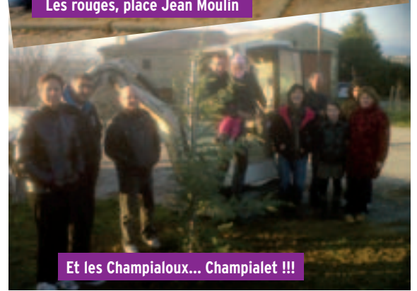
Et les Champialoux... Champialet !!!