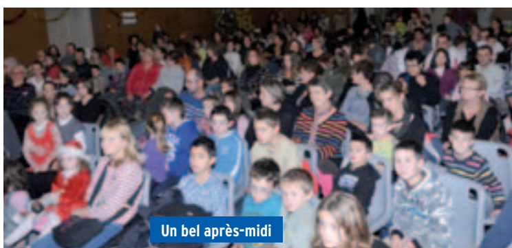
Un bel après-midi

Samedi 22 décembre, en avant-goût de Noël, les enfants du village étaient invités par la Municipalité pour un après-midi récréatif.