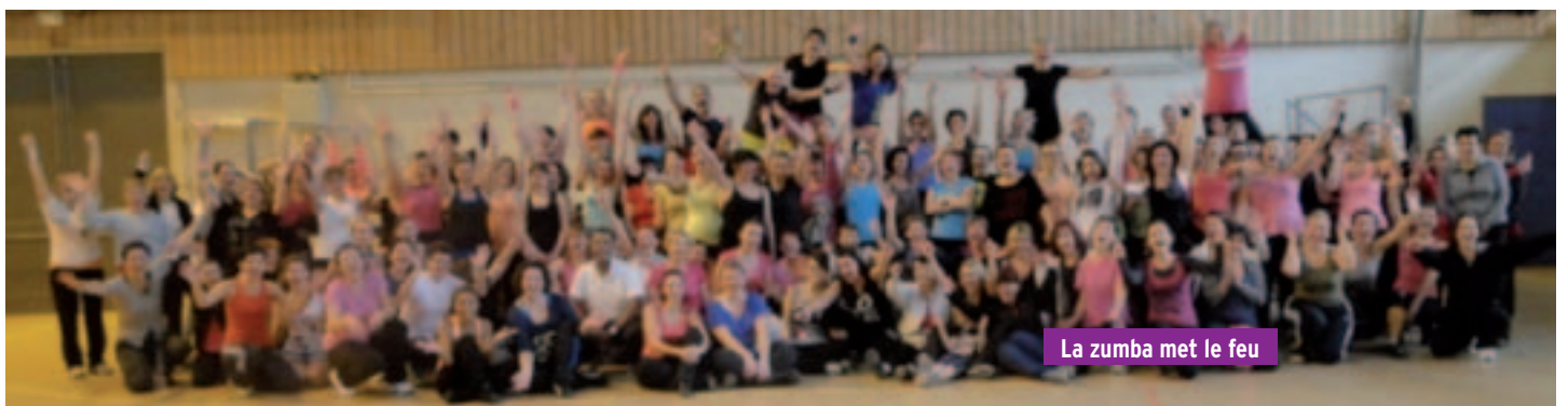
La zumba met le feu