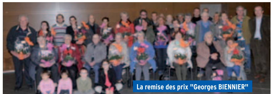
La remise des prix "Georges BIENNIER"

L'année prochaine nous serons encore plus nombreux !