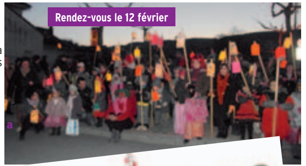
Rendez-vous le 12 février

Merci à la mairie pour cet arbre qui symbolise les «4 quartiers» qui s'affrontent lors de la manifestation de septembre. Jaune, Vert, Bleu et Rouge restent donc mobilisés toute l'année pour défendre leurs couleurs !