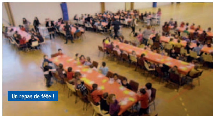
Un repas de fête !

Un grand merci également aux membres du personnel communal qui encadrent et veillent sur le bon déroulement de ce moment de détente et de convivialité.