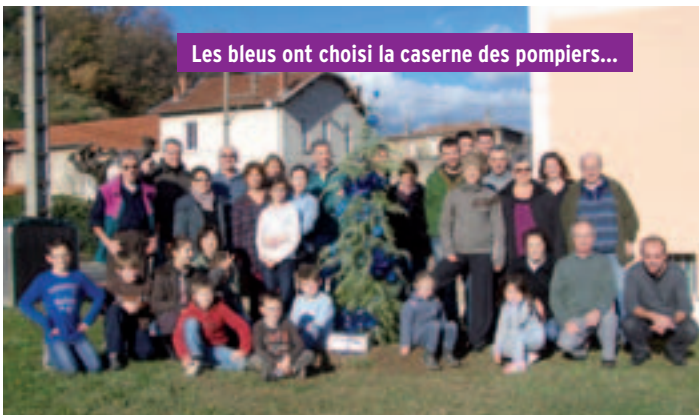
Les bleus ont choisi la caserne des pompiers...