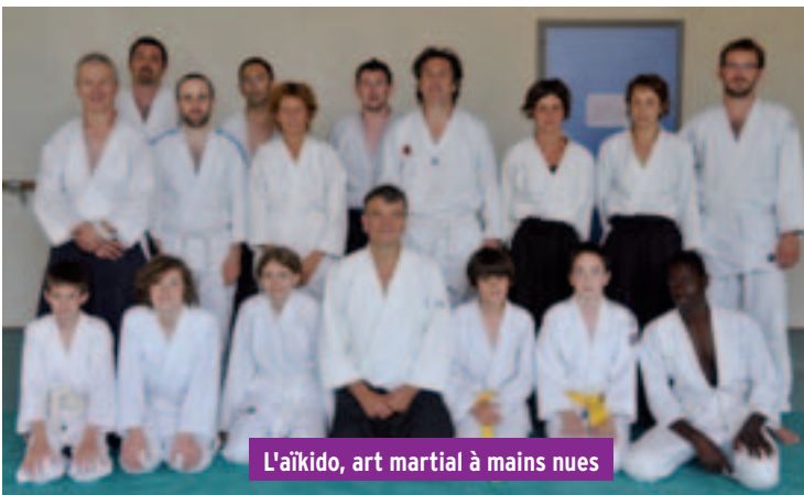
L'aïkido, art martial à mains nues

pascalchambre@gmail.com - http://aikidosarras.fr - 06 15 69 77 18