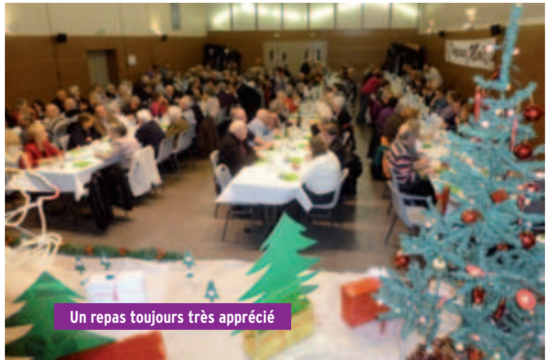
Un repas toujours très apprécié