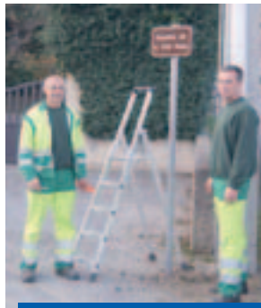
L'identification sera facilitée

Nous disposerons ainsi d'un outil de communication moderne et fiable.