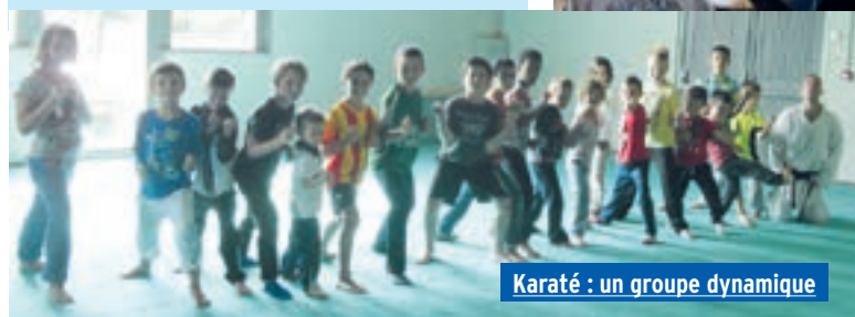
Karaté : un groupe dynamique