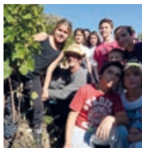
De l'aide pour les vendangeurs

Pour tous renseignements relatifs à ces inscriptions, merci de vous adresser en mairie à compter du 1 er novembre.