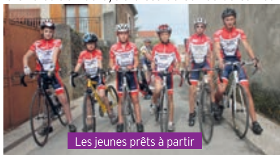
Les jeunes prêts à partir

Les dirigeants de Sarras Saint-Vallier cyclisme préparent activement la 34e édition du cyclo-cross de Sarras du samedi 25 octobre. Tracé