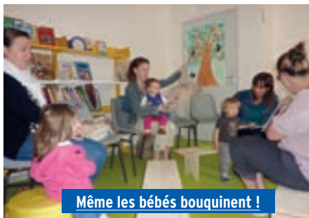
Même les bébés bouquinent !

L'équipe de la bibliothèque réfléchit à l'organisation de rendez-vous «café-lecture» au premier trimestre 2015 pour les adultes, ainsi qu'à des séances de contes pour les enfants de 4 à 12 ans.