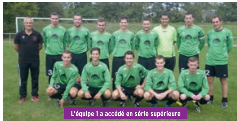
L'équipe 1 a accédé en série supérieure