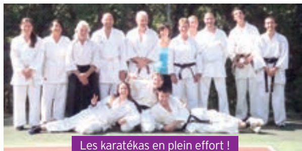
Les karatékas en plein effort !

Ce stage a permis à nos karatékas de consolider leurs liens et parfaire leurs connaissances dans un lieu agréable et convivial. Un moment sympathique pour clôturer une année de pratique.