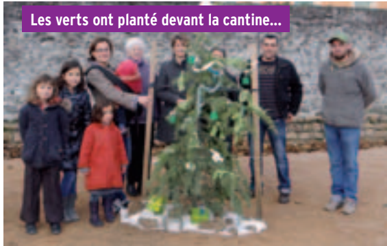
Les verts ont planté devant la cantine...

Tout le monde doit être costumé pour une ambiance festive réussie !