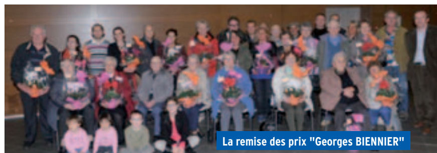
La remise des prix "Georges BIENNIER"

L'année prochaine nous serons encore plus nombreux !