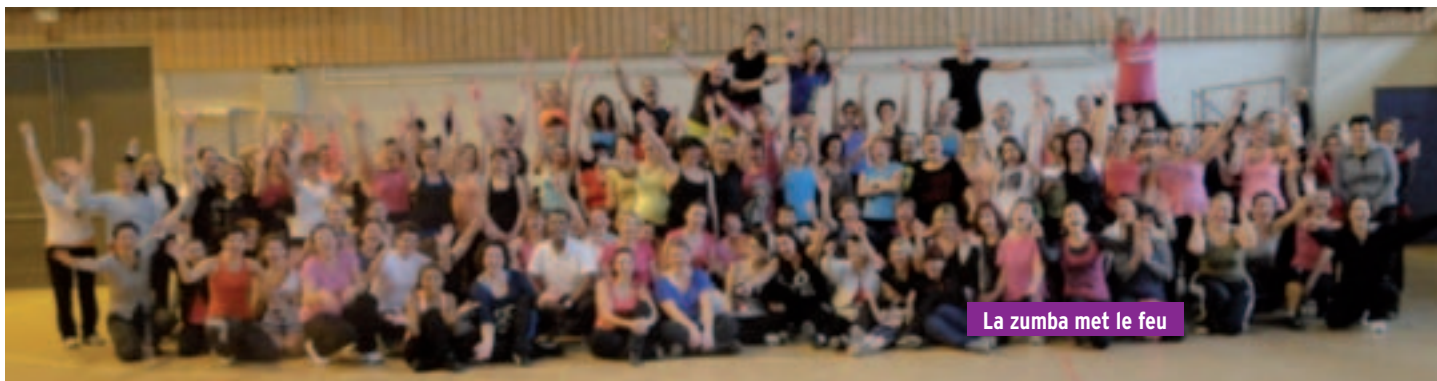
La zumba met le feu