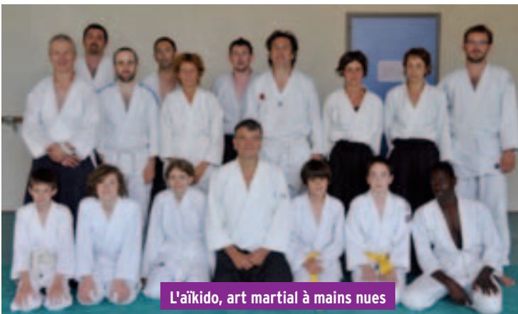
L'aïkido, art martial à mains nues

pascalchambre@gmail.com - http://aikidosarras.fr - 06 15 69 77 18