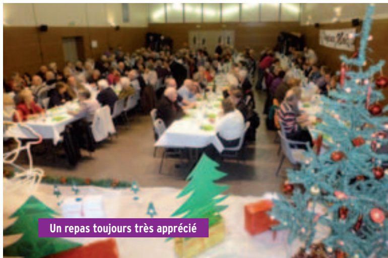
Un repas toujours très apprécié