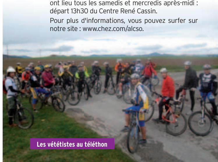
Les vététistes au téléthon

Pour plus d'informations, vous pouvez surfer sur notre site : www.chez.com/alcsoc .