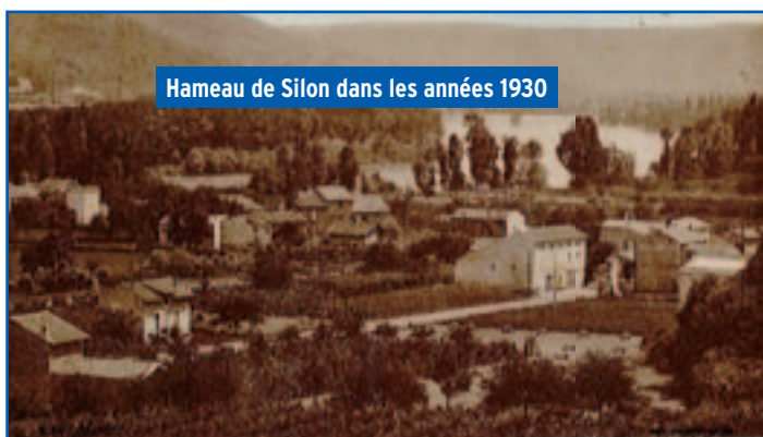
Hameau de Silon dans les années 1930

Le canal servait au rinçage du linge, une ou deux fois par an : le linge sale, principalement les draps, était descendu du grenier, vigoureusement frotté par des lavandières venues pour la journée de SARRAS. Il était déposé dans un grand cuvier de bois dans lequel on avait garni le fond d'une couche de sarments de vigne, d'une couche de cendres de bois, puis à nouveau des sarments de vigne et un linge posé à plat. L'eau bouillante était déversée sur le linge puis récupérée par le bas à nouveau réchauffée et déversée un grand nombre de fois. Retiré du cuvier, le linge était rincé à la rivière d'Ay pour les habitants du haut Silon, au canal pour le vieux Silon, ou dans le Rhône.