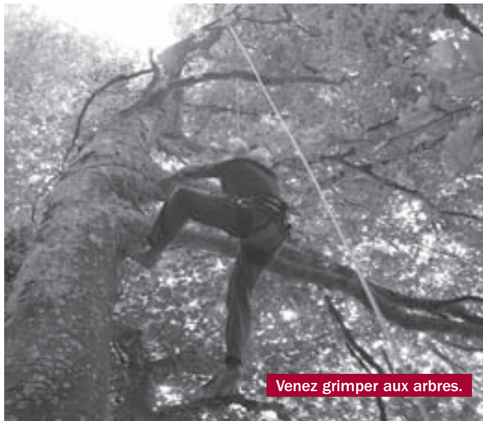
Venez grimper aux arbres.

L'association Natu'Rêve propose une découverte de l'environnement par des activités ludiques : Grimpe encadrée dans les arbres, course d'orientation, randonnées, animations autour du tressage ou de la forêt... Un programme d'animations est mis en place où chacun peut s'inscrire (consultable sur internet : http://natu.reve.free.fr ). D'autres dates sont possibles sur demande pour les groupes.