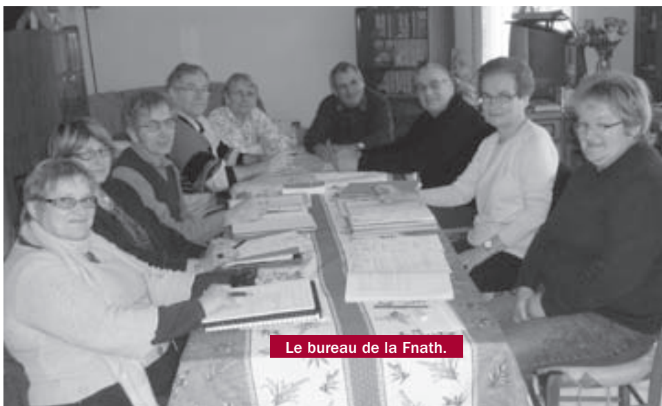
Le bureau de la Fnath.

Des sorties et rencontres conviviales sont aussi organisées, ne pas hésiter à nous contacter.