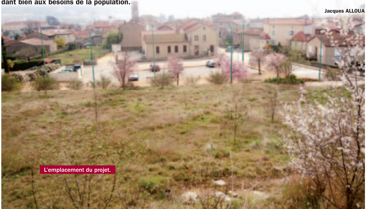
L'emplacement du projet.