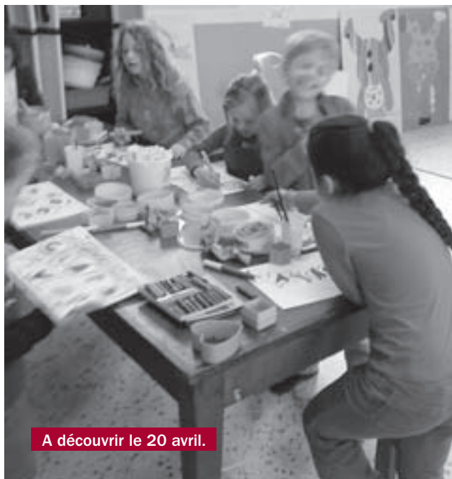
A découvrir le 20 avril.

Informations auprès de l'animatrice Valérie ARNAUD au 06 42 75 90 91.