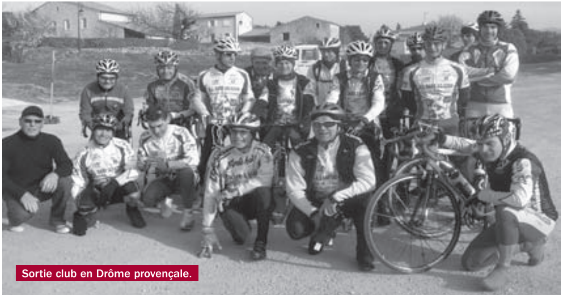
Sortie club en Drôme provençale.