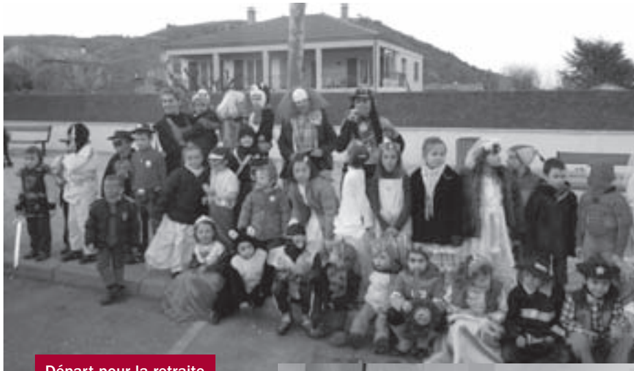
Départ pour la retraite aux flambeaux.

Cette année, un mardi-gras sans fougot mais avec les traditionnelles bugnes maison (humm...), les costumes des petits et grands (ouha...), la retraite aux flambeaux (ahhhh...), le chocolat et le vin chaud maison et la bonne humeur de tous pour ce moment de convivialité !