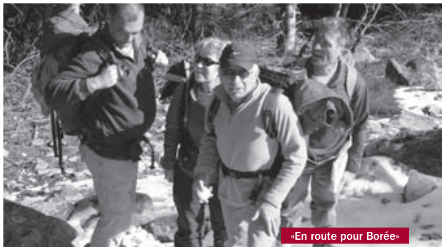
«En route pour Borée»

En avril-mai, une autre rando sera faite au départ de Mézilhac pour Antraigues sur deux jours.