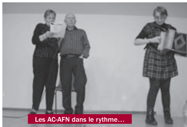
Les AC-AFN dans le rythme...

Activités chez les A.C.-A.F.N. au cours du premier trimestre 2011