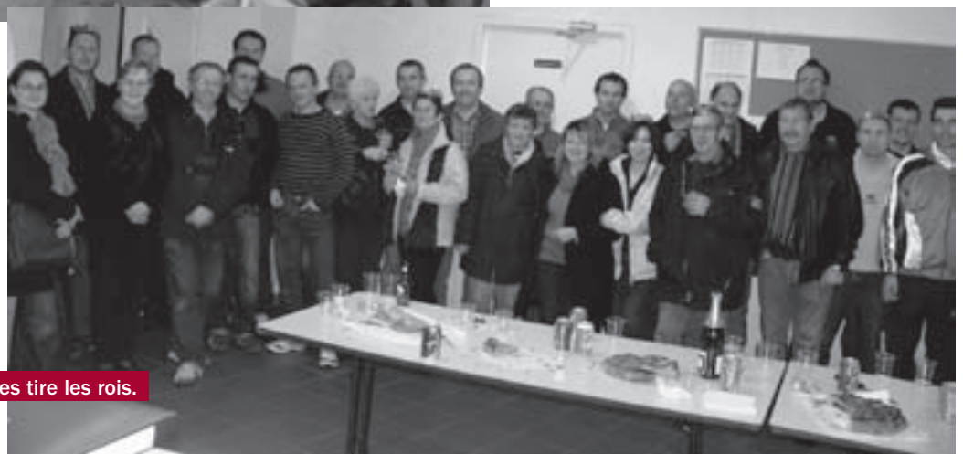
Le Comité des Fêtes tire les rois.

Venez nombreux partager ce moment de convivialité !