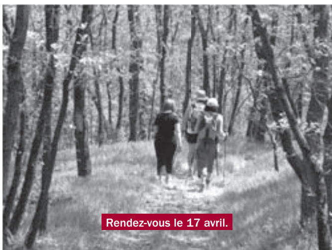
Rendez-vous le 17 avril.