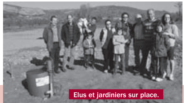
Elus et jardiniers sur place.

Plusieurs inscriptions ont déjà été prises, mais il n'est pas encore trop tard pour participer. Renseignements en Mairie.